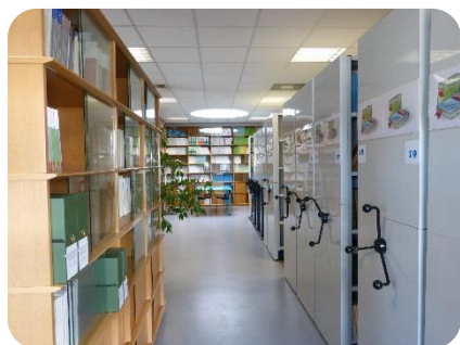
La Bibliothèque du LMA