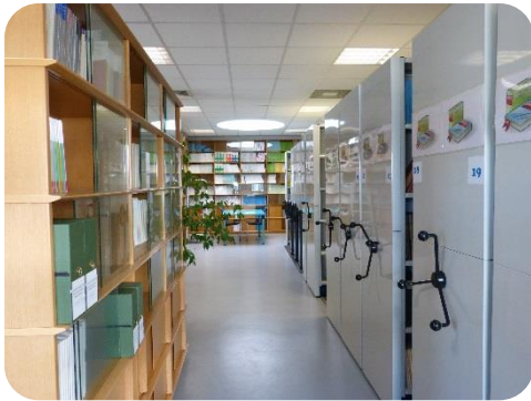
La Bibliothèque du LMA